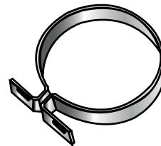
Abrazadera para montaje con tornillos 1/4" x 1 1/4"