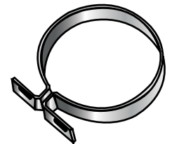
Abrazadera para montaje con tornillos 3/8" x 1 1/2